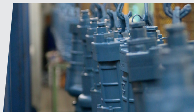
Assemblaggio, finitura e test di collaudo Assembling, finishing and testing