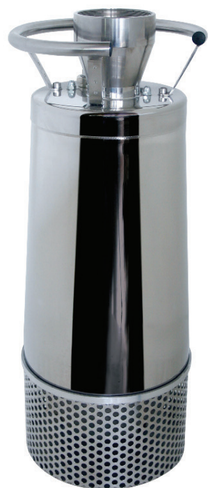
ELETTROPOMPE SOMMERGIBILI DRENAGGIO PER CANTIERISTICA SUBMERSIBLE ELECTRIC PUMPS FOR CONSTRUCTION WORK SITE DRAINAGE