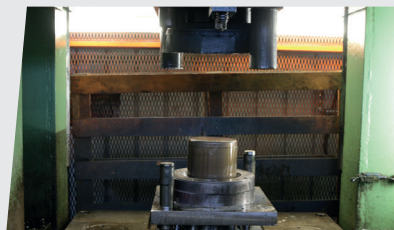
Deformazione a freddo dell'acciaio Deep cold forming of stainless steel