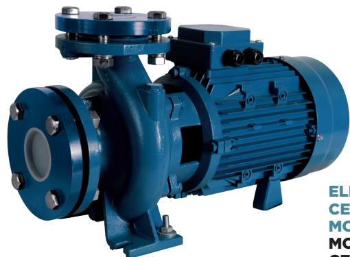
ELETTROPOMPE CENTRIFUGHE MONOBLOCCO MONOBLOCK CENTRIFUGAL PUMPS