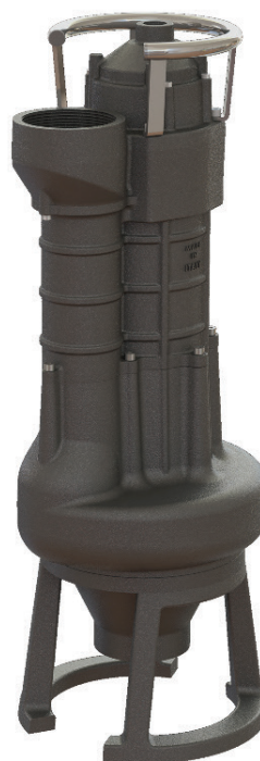
ELETTROPOMPE SOMMERGIBILI PER ACQUE CARICHE E FANGOSE