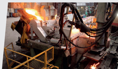
Componenti fonderia di fusione in ghisa e acciaio Foundry components iron casting and stainless steel casting