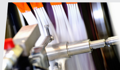
Alberi con saldatura in acciaio AISI316 Shafts with welding in stainless steel