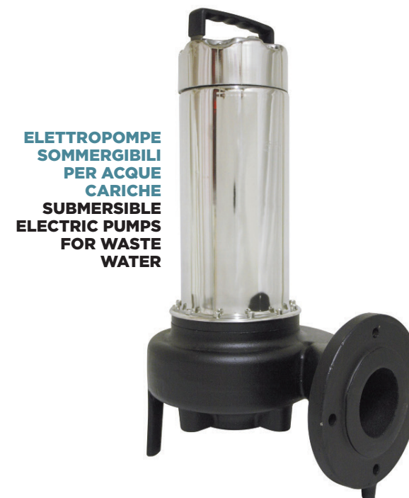
ELETTROPOMPE SOMMERGIBILI PER ACQUE CARICHE SUBMERSIBLE ELECTRIC PUMPS FOR WASTE WATER